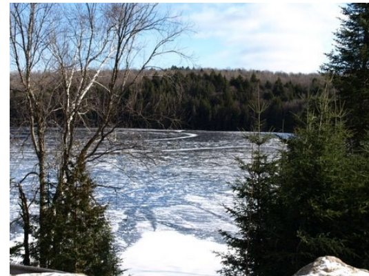
Exemple d'une vue sur le lac où seul l'accès est dégagé